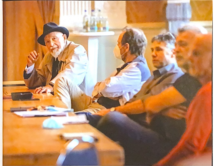
Regiebesprechung mit Team – eine ungewohnte Szenerie für den Maler, der sonst einsame Atelieratmosphäre gewohnt ist