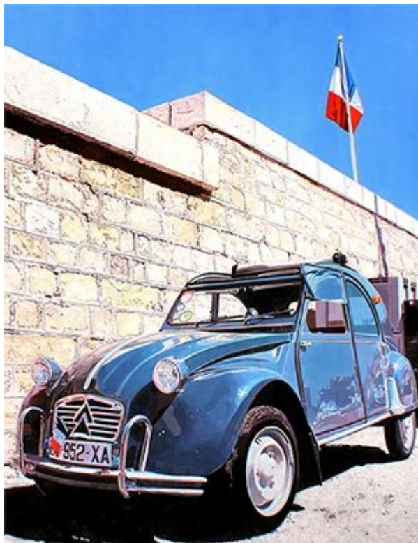
Citroën 2CV in Saint Tropez , 2020, 65×60 cm, Öl auf Pappe