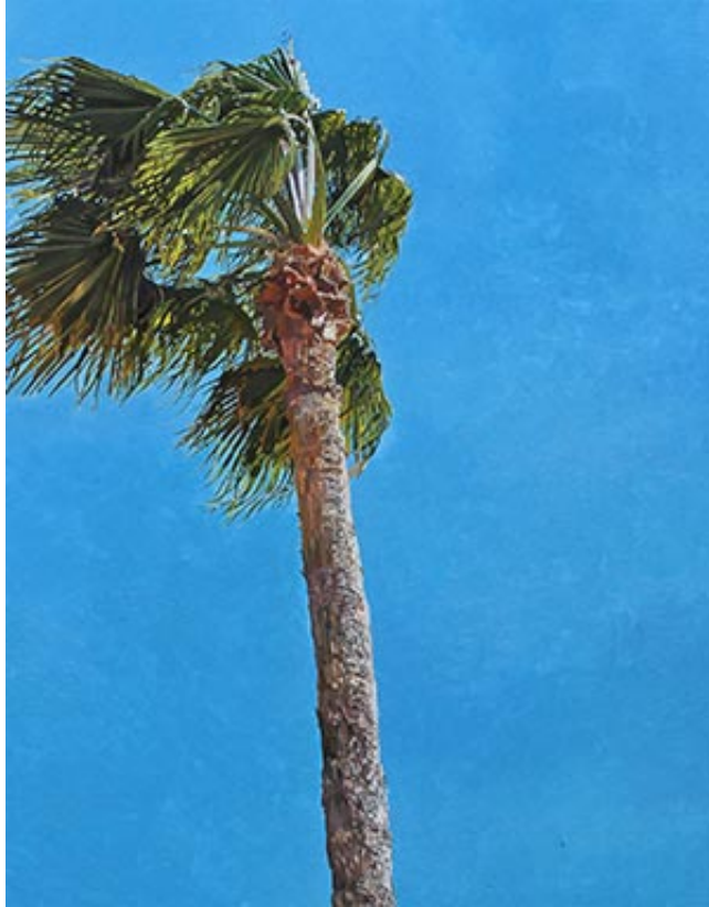
Cannes 1 , 2017, 65×60 cm, Öl auf Pappe