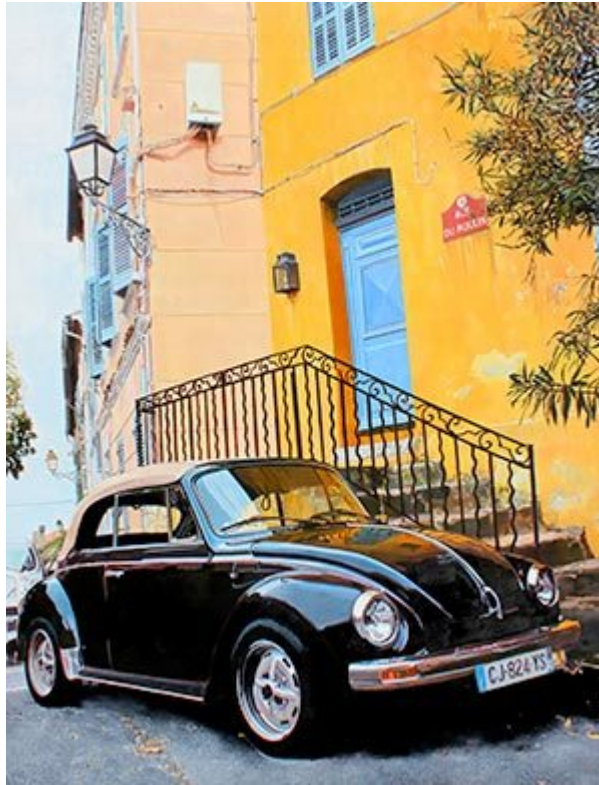
VW-Käfer in Grimaud , 2020, 65×60 cm, Öl auf Pappe